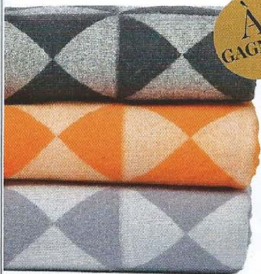
Plaids "Mirror Throw" en laine mérinos, design Verner Panton, 222 € l'un, VERPAN .