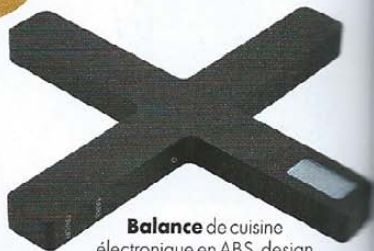
Balance de cuisine électronique en ABS, design The Tools, 50 €, EVA SOLO .