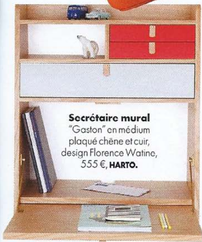
Secrétaire mural "Gaston" en médium plaqué chêne et cuir, design Florence Watine, 555 €, HARTO .