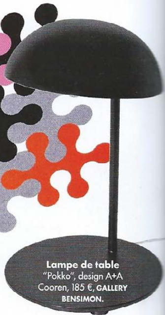
Lampe de table "Pokko", design A+A Cooren, 185 €, GALLERY BENSIMON .