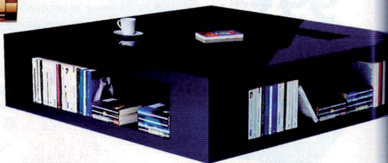
Table basse « Simone » en laque, Harto Design, 279 €, www.hartodesign.fr

Marque-pages , « Tabi », ligne 13 Maison Martin Margiela, 29 €, www.atelierdexercices.com